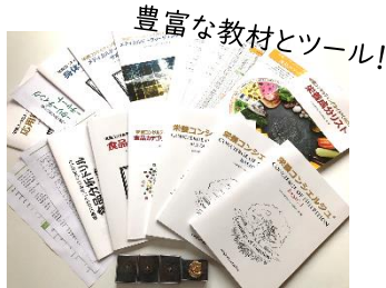
豊富な教材とツール!