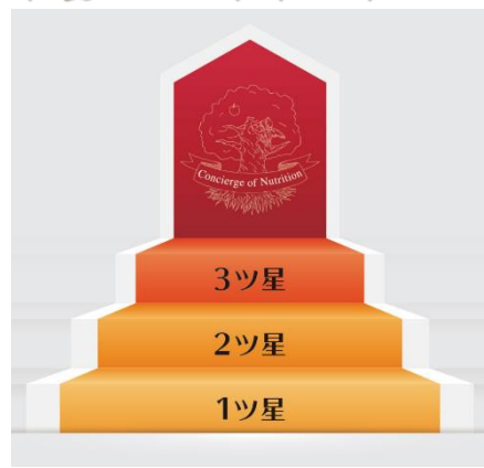
*3ツ星コース準備中