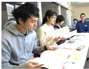
豊富な教材とツール!